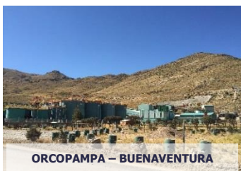
ORCOPAMPA – BUENAVENTURA