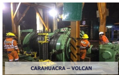
CARAHUACRA – VOLCAN

Teléfono: 51-1-6374134 51-1-6375442 www.misol.pe