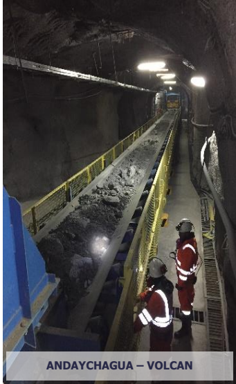
ANDAYCHAGUA – VOLCAN