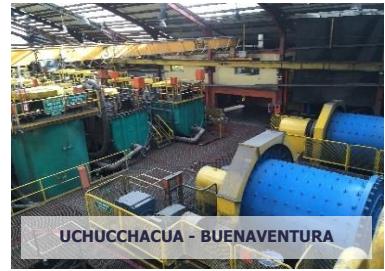
UCHUCCHACUA - BUENAVENTURA