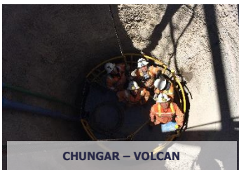
CHUNGAR – VOLCAN