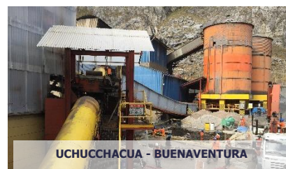
UCHUCCHACUA - BUENAVENTURA