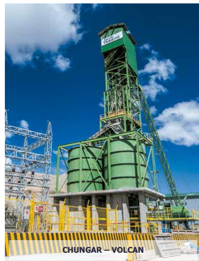
CHUNGAR – VOLCAN