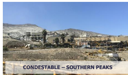
CONDESTABLE – SOUTHERN PEAKS

Av. Manuel Olguín 501 of. 507 - Santiago de Surco Lima, PERÚ