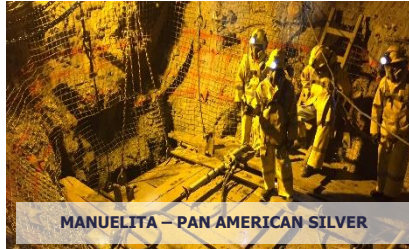
MANUELITA – PAN AMERICAN SILVER